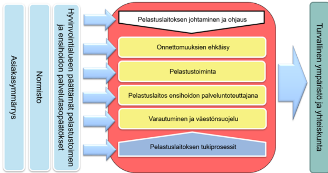
Kuva 1. Pelastuslaitoksen prosessikartta esittää kokonaiskuvan ja kuvaa organisaation ydinprosessit.