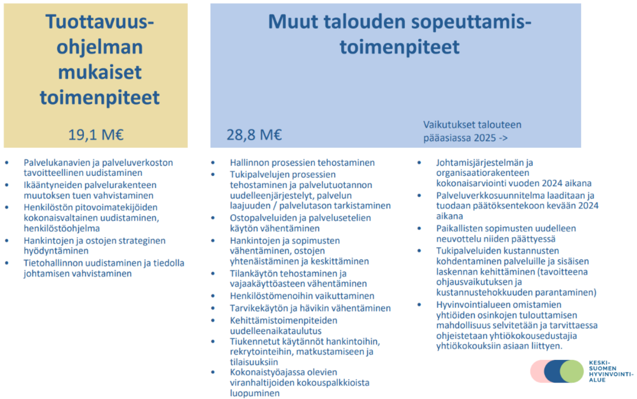
Kuvio 3. Keski-Suomen hyvinvointialueen sopeuttamistoimenpiteet vuodelle 2024.

Esimerkkinä mainittakoon, että palveluverkkoesityksen mukaisten toimien arvioidaan vähentävän kustannuksia 12,3 miljoonaa euroa vuosittain viimeistään vuoteen 2030 mennessä. Puolivuotiskatsauksessa linjataan, että operatiivisessa lähijohtamisessa kiinnitetään huomiota erityisesti taloudellistoiminnallisiin toimenpiteisiin.