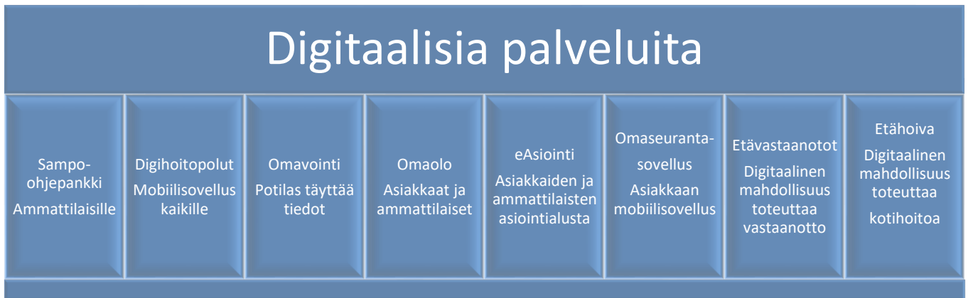
Taulukko 7. Keski-Suomen hyvinvointialueen digitaalisia palveluita.

Tarkastuslautakunnan mukaan uudenlaiset digitaaliset palvelut parantavat asiakaspalvelua ja voivat samalla alentaa kustannuksia. Digitalisaation avulla mahdollistetaan palvelujen tarkoituksenmukainen järjestäminen, sujuva tiedon kulku ja tiedolla johtaminen. Digitaalisia palveluita käyttävät asiakkaat ovat pääsääntöisesti tyytyväisiä (Asiakkuuskertomus, 2023). Tarkastuslautakunta arvioi digitaalisten palveluiden vaikuttavuutta, kustannuksia ja takaisinmaksuaikaa vasta sitten, kun on saatu kerättyä riittävästi tietoa käyttäjäkokemuksista.