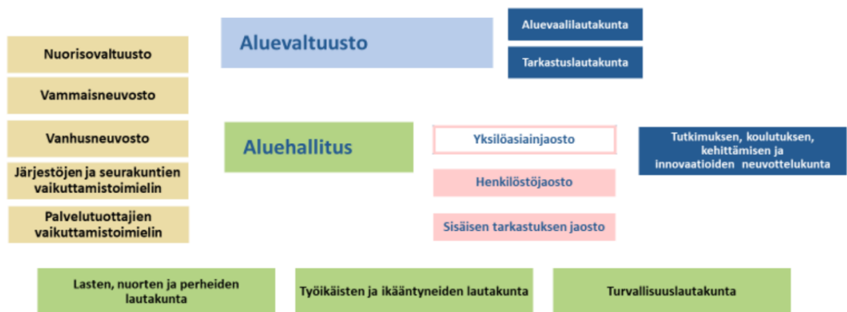
Kuvio 5. Keski-Suomen hyvinvointialueen toimielinrakenne.

Hyvinvointialueen sopeuttamistoimenpiteisiin on linjattu kokouksiin ja muihin tilaisuuksiin liittyviä käytänteitä. Linjauksissa on ohjeistettu, että kokouskäytänteitä sujuvoitetaan ja kokouksiin kutsutaan vain tarpeelliset osallistujat. Digitaalisia työkaluja tulee hyödyntää tehokkaasti ja ensisijaisesti käytetään etäkokouksia, jolloin säästetään osallistujien aikaa ja matkakulukorvauksia. Lisäksi on linjattu, että kokoukset tulee järjestää ensisijaisesti hyvinvointialueen hallinnoimissa tiloissa. Sopeuttamistoimenpiteissä on myös linjattu, että kokouksissa ja tapaamisissa ei järjestetä tarjoilua hyvinvointialueen kustannuksilla.