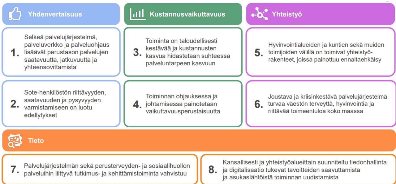
Kuvio 1. Valtakunnalliset strategiset tavoitteet sosiaali- ja terveydenhuollon järjestämiselle.

Sosiaali- ja terveydenhuollon valtakunnallisia tavoitteita on yhteensä kahdeksan (kuvio 1). Sosiaali- ja terveydenhuollon tavoitteiden ytimessä ovat yhdenvertaisuus, kustannusvaikuttavuus, yhteistyö ja tieto.