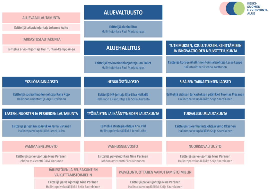
Kuvio 2. Keski-Suomen hyvinvointialueen toimielinten esittelijät ja pöytäkirjanpitäjät.

valmisteilla konsernipalveluiden hallintopalveluiden toimesta edellisen järjestelmän poistumisesta lähtien. Korvaava sidonnaisuusrekisteri tullaan ottamaan käyttöön syksyn 2024 aikana tarkastuslautakunnan omaa järjestelmähankintana.