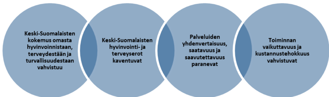
Taulukko 3. Keski-Suomen hyvinvointialuestrategian tavoitteet.

Hyvinvointialuestrategian toteutumista arvioitaessa arviointikertomuksessa esitetään tarkastuslautakunnan näkemys hyvinvointialuestrategian tavoitteiden toteutumisesta. Samalla voidaan myös arvioida, toteuttavatko talousarviossa asetetut tavoitteet hyvinvointialuestrategiaa. Hyvinvointialuestrategian toteuttamisohjelmien toteutumista arvioitaessa arviointikertomuksessa esitetään tarkastuslautakunnan havainnot ja näkemys siitä, miten ohjelma on toteutunut ja onko ohjelman toteutuksessa edetty strategisten tavoitteiden suuntaan (taulukko 3).